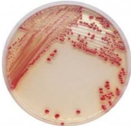
Colorex™ Acinetobacter: coltura di Acinetobacter spp. (colonie rosse).